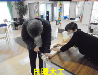
日曜大工 クラフト工芸

「今、一番したい事は何かですか？」たとえ、それが今出来なくても、いつかきっと出来るようになる、を信じて。そのためにケアマネさんや包括の職員さんと力を合わせて精一杯応援します。それがアローズです。だからアローズを選びます。