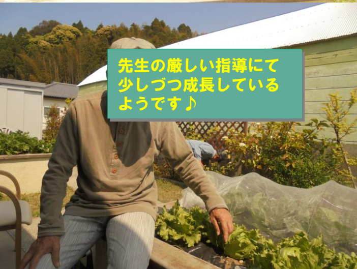
先生の厳しい指導にて 少しずつ成長している ようです♪