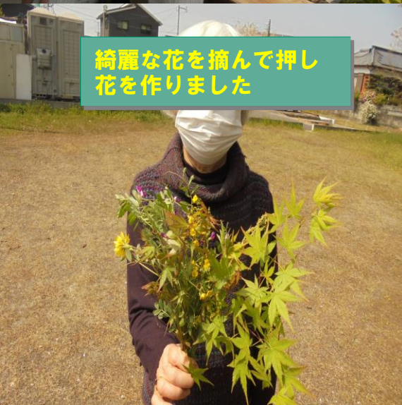
綺麗な花を摘んで押し 花を作りました