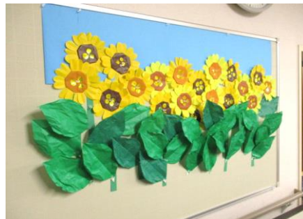
斜めから見ると・・・

向日葵の壁画の完成図です。非常に夏らしい作品ですね!! ペーパークラフトは、大変ですが完成したときの達成感が気持ち良いです(*'ω'*) 正面から見ると分かりづらいのですが・・・実はこれ、立体的な作品なんです!! 葉っぱの立体感を見て(°Д°)♡近くで見たら「おお・・・」と、圧迫感を感じるくらいあります(笑)